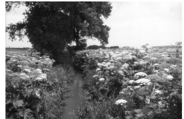
Herkulesstaude an der Selz bei Friesenheim (1996)